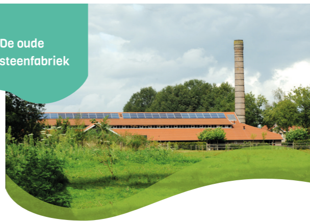
De oude steenfabriek

Deze biologische wijngaard met ruim 16.000 stokken ligt verscholen tussen de pracht van Chaam. Ben je nieuwsgierig aangelegd? Loop dan even de wijngaard in om te spieken. De winkel is bijna elke dag open, maar als je even belt, weet je het zeker.